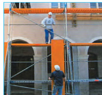
Plataforma FIPRO 2,57 m. Plataforma FIPRO 3,07 m.

Esto significa que cuando se utilizan plataformas FIPRO en lugar de la plataforma de aluminio, existe un ahorro de peso de 11.433 kg por montador cada año.