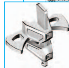
Fijación para barandilla interior Ref. n.º 2636.000