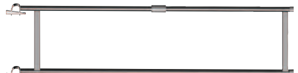
Barandilla interior de terminación de escalera Ref. n.º 0718.592

Para más información sobre empresas filiales y distribuidores consulte nuestra página web: